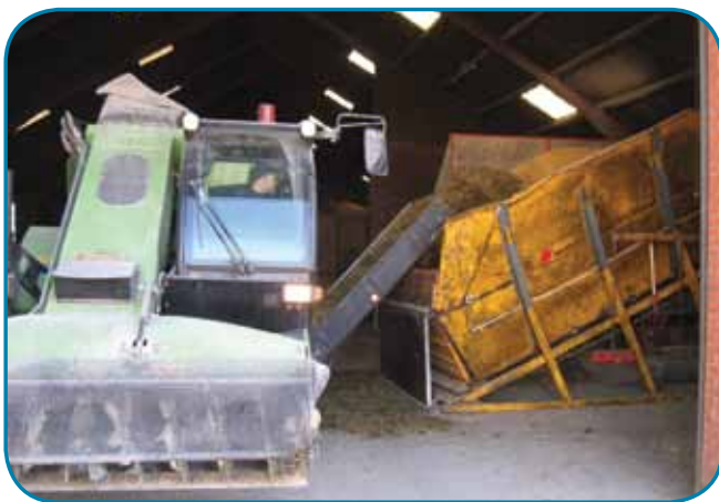
מילוי האבוס באמצעות מסוע

בהתחלה חיפשנו דרכים להחליף את אופן האבסה המקובלת ולבטל את העגלה שמחלקת מזון לאורך האבוסים המקורים. ישנם פתרונות פשוטים ומעניינים שמאפשרים להגיש לפרה אוכל טרי על גבי מסוע, בכל שעה, מתוך מכל אחסון ביניים בקצה הסככה. אבל עדיין מיקום האבוס הוא קבוע ולכן יש צורך במדרך בטון לפרות. המשכנו והגענו אל פיתוח רעיון של האבסה באבוסים ניידים. ישנם כאלה בשימוש בשדות הירוקים של אירופה (ראה תמונה) ולמה לא