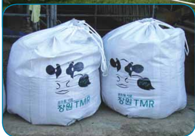
מאריזי בליל לחולבות

אולי שטח רב לפרה אבל עלות הבנייה היא רק כ-50% מעלות בניית סככה "סטנדרטית" וזה ללא התחשבנות בעובדה שלא צריך לבנות ולהפעיל מערכות לטיפול בזבל. כאן הזבל מטופל בתוך הסככה וייהפך ל"סמי קומפוסט", שהמהווה מקור הכנסה נכבד נוסף לרפת. בינתיים לומדים איך לתחזק את הסככה - הרי באירופה קשה יותר - אבל אין ספק שאנחנו בכוון אל הסככה העתידית שאחרי הסככה המרחבית.