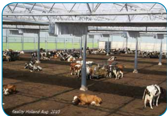
הולנד 2010 - סככה מרחבית

באוגוסט 2010 נחנכה הרפת הראשונה מדגם זה, 5,000 מ"ר חממה לשיכון 200 פרות.