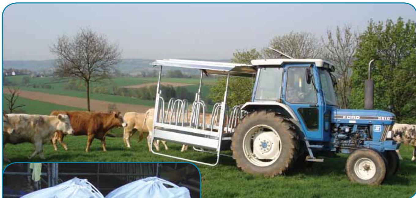
אבוס נייד בשטח