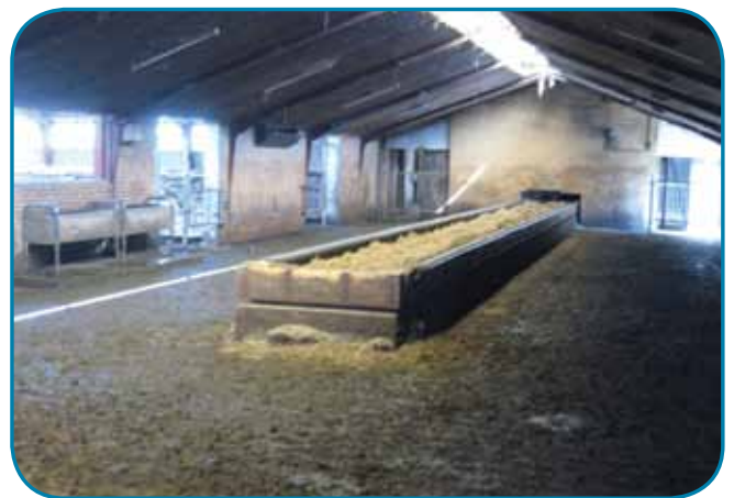
אבוס פנימי ברפת בדנמרק